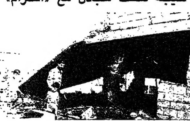
مثال اصيب في سحر